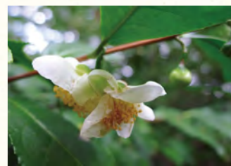
こぼれそうなフサフサ雄しべに白い花びら 2012年11月 新宿御苑

最近すっかり見かけなくなった花のひとつに、お茶の木の花がある。以前は里山の道端や庭の垣根などで普通にお茶の木の白い花を見かけたものだが、宅地化の波に飲み込まれたのか絶滅の危機に瀕しているようだ。落ち葉で焚き火をした思い出と共に、丸くころんと下向きに咲くかわいい花を見つける楽しみも、昔話になってしまうのはちょっと寂しい。