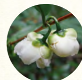
スズランのような蕾

茶はツバキやサザンカと同じ仲間、秋が深まる頃に白い花をつける。お茶畑で花を見かけないのは、茶葉が育つように花芽は早い時期に摘み取られるから。しかし天候異常などで花が咲くこともあるらしい。その花に含まれるフローラテアサポニンという成分はダイエットや糖尿病に